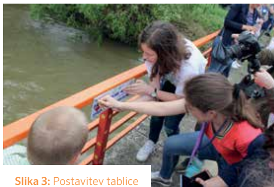
Slika 3: Postavitev tablice visokih voda na mostu na Sotli

konference smo se odpravili še v Brežice, kjer smo si ogledali hidroelektrarno na spodnji Savi.