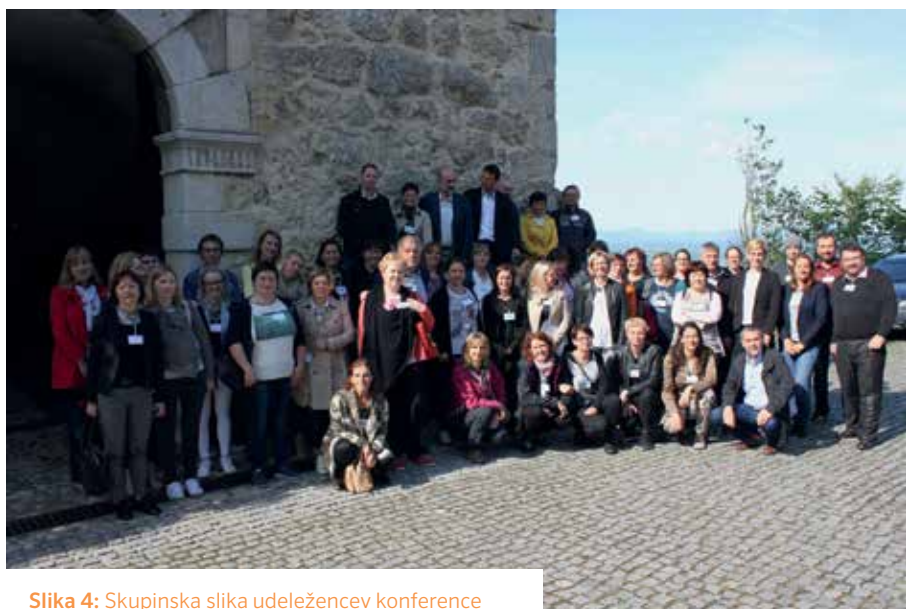
Slika 4: Skupinska slika udeležencev konference pred gradom Podsreda

Učitelji so v svojih predstavitev predstavili številne zanimive in poučne pristope poučevanja o vodi in vodnih virih. Predstavljene aktivnosti izvajajo tako pri rednem pouku kot pri dodatnih dejavnostih, pri svojem delu uporabljajo različno raziskovalno metodologijo, v prvi vrsti pa se posvečajo terenskemu raziskovanju lokalnih vodnih virov, ki je pogosto zasnovano interdisciplinarno (geografija, biologija, kemija idr.). Predstavili so tudi tehnično plat izvedenih aktivnosti, zlasti časovni vidik, potrebne pripomočke, pa tudi skrb za varnost. Učenci in dijaki tako spoznavajo lokalno okolje, raziskujejo katere vodne vire imajo, njihove značilnosti ter kakšen je njihov pomen, s čimer razvijajo odgovoren odnos do okolja in vodnih virov, kar vpliva tudi na njihovo ozaveščenost. Učenci in dijaki tako s svojim znanjem postanejo pomembni sogovorniki v lokalnem okolju.