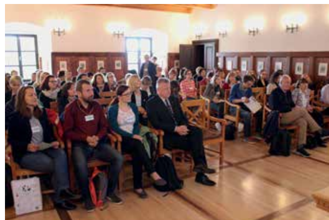
Slika 1: Zanimanje za konferenco s strani učiteljev je bilo zelo veliko k čemur so prispevali tudi vsebinsko zelo zanimivi referati.

Za dosego omenjenega cilja smo geografi pripravili in izvedli mednarodno konferenco Zaživimo z vodo, na kateri so učitelji geografije in nekaterih drugih strok predstavili primere dobrih praks obravnave navedenih vsebin v šolah. Konferenca je potekala v Podsredi in Bistrici ob Sotli 31. maja in 1. junija 2019 v organizaciji Društva učiteljev geografije Slovenije, Ministrstva RS za okolje in prostor, Kozjanskega parka ter OŠ Bistrica ob Sotli. Osrednja tema konference je bila poučevanje o vodi in ravnanje z vodo in vodnimi viri (Splet 1). Konference se je udeležilo nekaj več kot 80 učiteljev, v prvi vrsti geografije, iz Slovenije in Hrvaške, ki so v dveh dneh prisluhnili skoraj petdesetim referatom. Večina prispevkov je