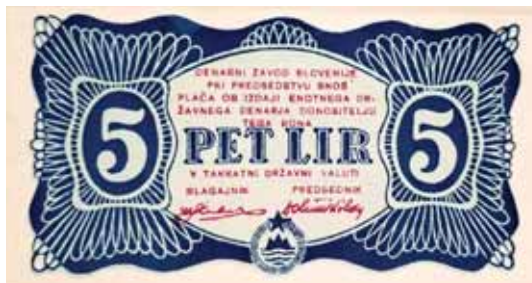
Slika 5: Triglav upodobljen na partizanskem denarju, na slovenskem plačilnem bonu za 5 lir (1. serija, osnutek naredil Branko Simčič) iz leta 1944.

Vsi ti prvi znaki Osvobodilne fronte so imeli poleg stožcev Triglava napisani še črki OF (Kos, 1983, str. 8). Proti koncu vojne pa je črki OF zamenjala (rdeča) zvezda.