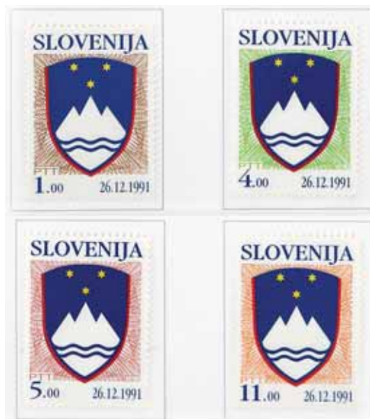
Slika 7: Triglav se pojavi tudi na prvih poštinih znamkah samostojne države.

Januarja 1947 je ustavodajni odbor sprejel končno odločitev glede republiškega grba, člen v ustavi se glasi: »Državni grb Ljudske republike Slovenije je polje, obdano z žitnim klasjem. Klasje je spodaj povezano s trakom in prepleteno z lipovimi listi. Med vrhovoma klasja je peterokraka zvezda. V spodnjem delu polja so na dnu tri valovite črte, predstavljajoče morje. Nad njimi se dvigajo trije stožci, katerih srednji je višji, stranska pa sta enaka; stožci predstavljajo Triglav.« (Ustava Ljudske republike Slovenije 1947, člen 3, 4). V slavnostni izdaji ustave iz leta 1947 je grb naslikan z zlato barvo in rdečo obrobo, zvezda pa je rdeča in ima zlato obrobo. V drugih publikacijah se uporabljajo različne variacije (Enciklopedija Slovenije, 1989, str. 378–379). Slovenski grb je opisan tudi v ustavi Federativne ljudske republike Jugoslavije iz leta 1948: »Državni grb Ljudske republike Slovenije je polje, obdano z žitnim klasjem. Klasje je spodaj povezano s trakom in prepleteno z lipovimi listi. Med vrhovoma klasja je peterokraka zvezda. V spodnjem polju so na dnu tri valovite črte, predstavljajoče morje. Nad njimi se dvigajo trije stožci, katerih srednji je višji, stranska pa sta