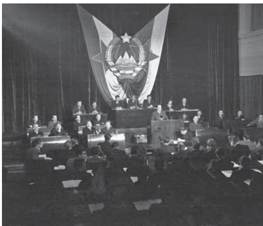
Slika 6: Triglav v slovenskem grbu na zasedanju ustavodajne skupščine leta 1946.

uveljavila, četudi so jo veliko uporabljali, pač pa sta lipovi vejici in trak, ki ju povezuje, prišli v kasnejšo podobo grba (Kos, 1983, str. 10–11). Simčič je marca 1944 izdelal naslovnico pisemskega papirja in osnutek za žig predsedstva Slovenskega narodnoosvobodilnega sveta. Na njima je upodobil grb s Triglavom in morjem. Obdana sta z vencem žitnih klasov, povezanih s trakom, ki zgoraj oklepajo peterokrako zvezdo. To je že podoba republiškega grba, ki je ob ustavni uzakonitvi dobila samo še lipovi vejici. Venec žitnih klasov okoli srednjega dela grba je gotovo posnet po grbu Sovjetske zveze in po znaku, ki so ga jugoslovanski komunisti uporabljali v dvajsetih letih (Kos, 1983, str. 11).