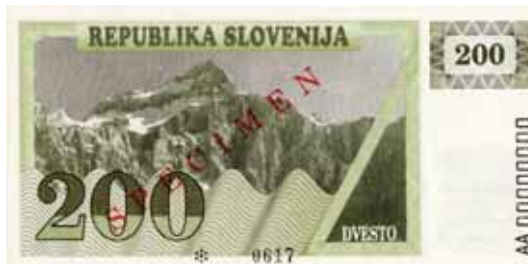
Slika 8: 8. oktobra 1991 je Banka Slovenije izročila v obtok vrednostne bone kot začasni, nov denar samostojne države Slovenije s Triglavom na njem.