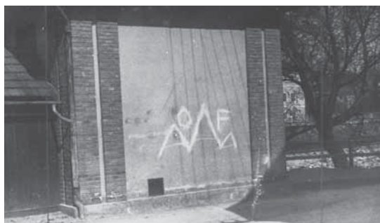
Slika 4: Triglav kot znak Osvobodilne fronte.

šesterokraka zvezda grofov Celjskih (Mikša, 2017). Plečnik ga je kot slovenski simbol uporabil tudi na pročelju vhodnih vrat Narodne in univerzitetne knjižnice. Ko ji je bil leta 1945 priznan tudi pravni status slovenske nacionalne knjižnice in je postala Narodna in univerzitetna knjižnica v Ljubljani, so do leta 1948 nad vhod namestili nov napis in na balkonsko balustrado slovenski grb. Tega je pod Plečnikovim nadzorstvom po vsej verjetnosti risal Peter Trpin (Rapoša, 1997).