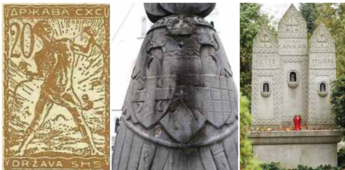
Slika 3: Triglav se kot simbolna slovenska gora pojavi že na prvi slovenski znamki, na t. i. Verigarju leta 1919 (levo;), prvič pa ga je leta 1934 kot simbol Slovencev v grb postavil najpomembnejši slovenski arhitekt Jože Plečnik (sredina;). V obliki Triglava je oblikovan tudi nagrobnik treh največjih slovenskih literatov iz časa slovenske moderne (Ivan Cankar, Dragotin Kette, Josip Murn).

»Osvojitve« Triglava pred nemškimi planinci je bil za Slovence simbolni dokaz, da je gorski svet slovenski, da prostor pod njimi naseljuje slovenski narod.