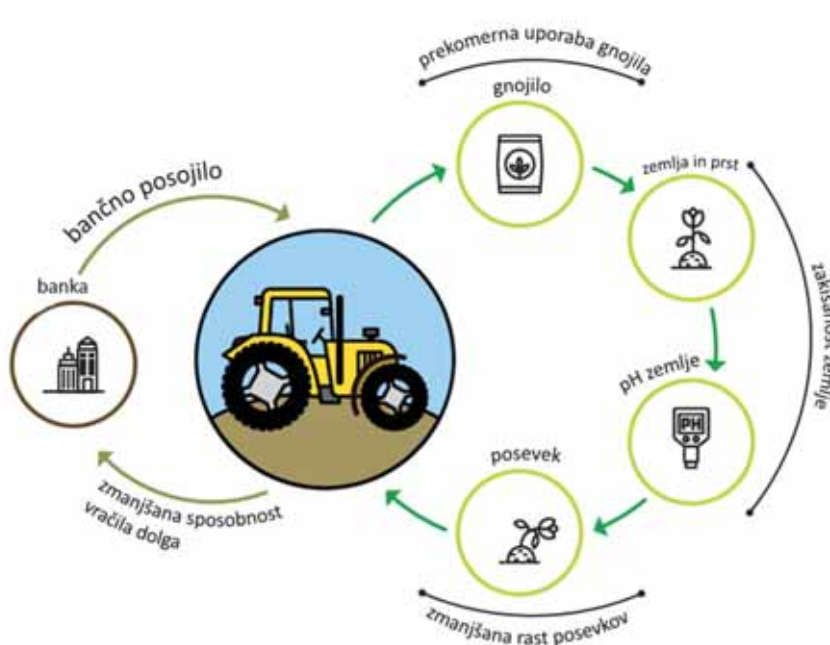
Slika 4: Vpliv težke mehanizacije na kakovost prsti (prevedeno po: Ascui in Cojoianu, 2019)

Intenzivno kmetijstvo pomembno vpliva na prsti kot naravni vir, zlasti z uporabo mineralnih gnojil in fitofarmaceutskih sredstev. Če slednje odmislimo, dobimo poenostavljen primer, kako kmetovalci prek ravnanja z ekosistemi vplivajo na svojo finančno situacijo. Na Sliki 4 je prikazan poguben proces intenzifikacije kmetijstva z nakupom večje opreme, za kar je potrebno