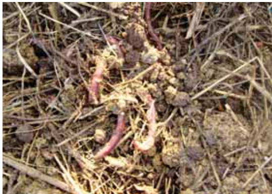
Slika 3: Deževniki so znak rodovitnosti zemlje.

Lastnosti prsti so kazalci abiotskih in biotskih dejavnikov, ker nastajajo s preperevanjem zgornjega trdega dela zemeljske skorje, ki se s preperevanjem in učinkovanjem rastlin in živali preobrazi v rodovito plast. Pomemben člen v sooblikovanju lastnosti prsti je tudi človek, ki mnogostransko spreminja njihove naravne značilnosti.