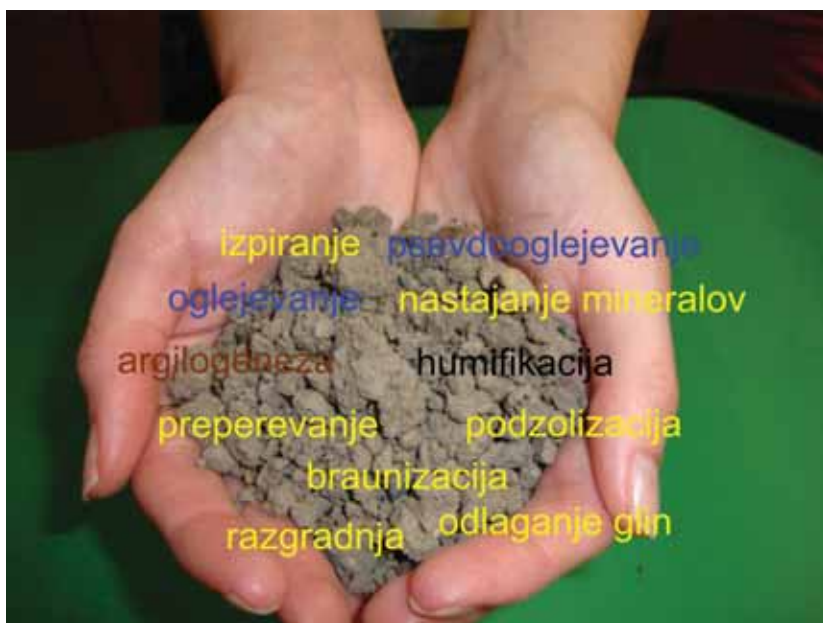
Slika 2: V prsti potekajo številni procesi brez prestanka, kar vpliva na rodovitnost prsti.

Proces tvorbe humusa iz organskih ostankov imenujemo humifikacija. Potek humifikacije spremlja mineralizacija, kjer se del odmrle organske snovi popolnoma razkroji na sestavne dele (CO 2 , H 2 O, NH 3 , H 2 S in druge elemente).