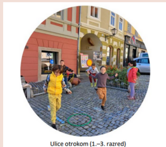
Ulice otrokom (1.–3. razred)