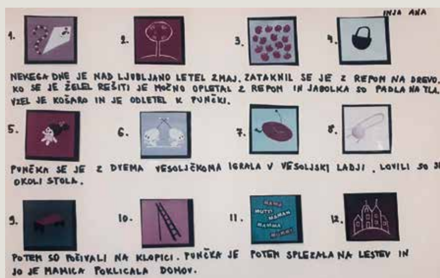
► SLIKA 2: Pripovedovanje s slikami, vir: Vrtec Vodmat

Odziv otrok na film Obisk z vesolja je bil poln emocij in postopnih sporočil otrok. Pogovor je začel deček, ki je želel sporočiti, kako se je počutil, ko je odšel z babico na vikend. Tam se je imel lepo, a vseeno je pogrešal svojo mamicco. Pripravili