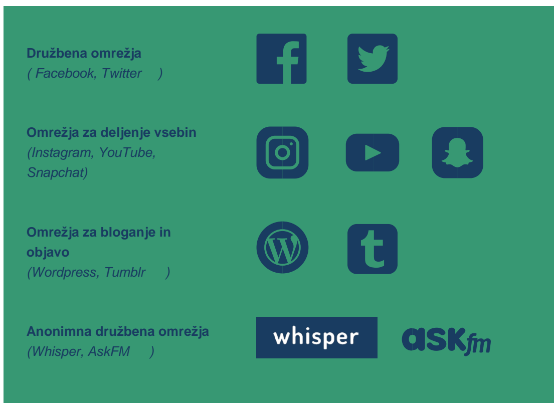
Slika 4 Nekaj primerov družbenih medijev

Upoštevajte, da je treba spremljati priljubljenost in razširjenost nekaterih spletnih strani ali aplikacij, ker se lahko zelo hitro in korenito spreminjajo. Zavedanje (znotraj strokovnih meja), kako naj učenci uporabljajo družbene medije, je lahko pomemben del sodobnega izobraževanja.