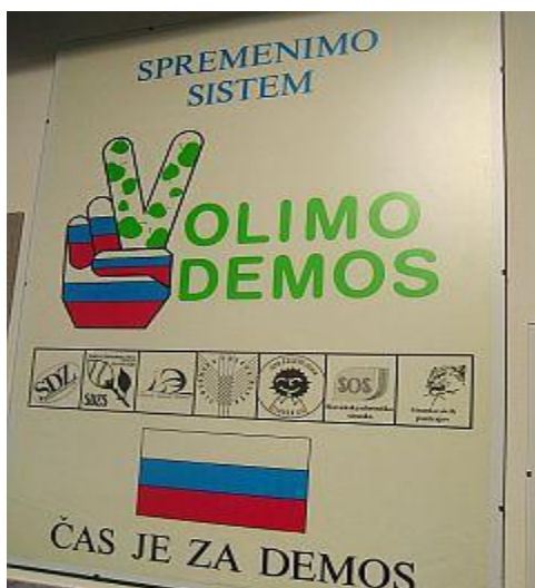
Prve večstrankarske volitve.