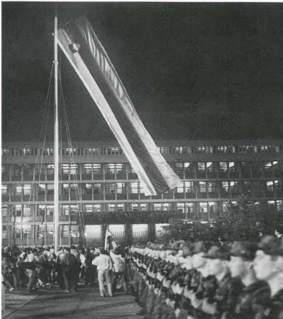
Zaplapolala je slovenska zastava.