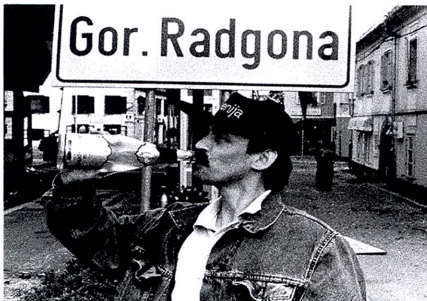
Osamosvojitve je bila razlog za slavje leta 1991 - pa zdaj?